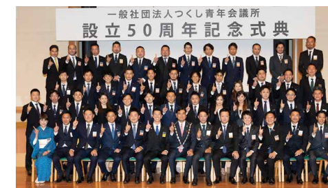
設立50周年記念式典