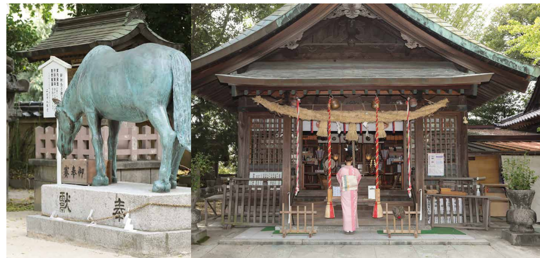
●二日市八幡宮 【住】筑紫野市二日市中央 3-6-35