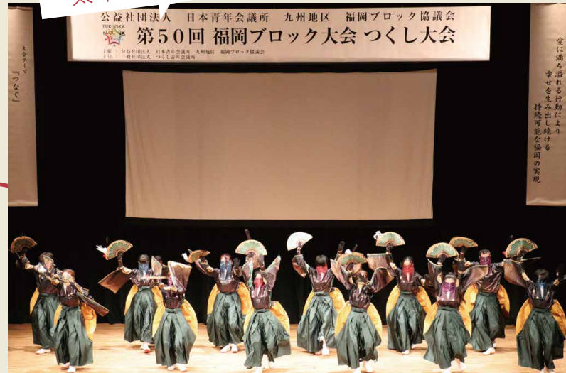
オープニングアクトは覆面和踊り集団の「太宰府まほろば衆」!!