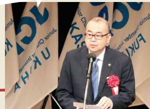
太宰府市長の楠田大蔵氏より祝辞をいただきました