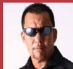
「黒のカリスマ」 蝶野正洋氏