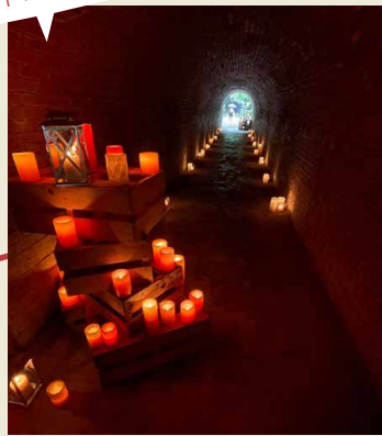
地域に明かりを灯し、史跡を彩りました