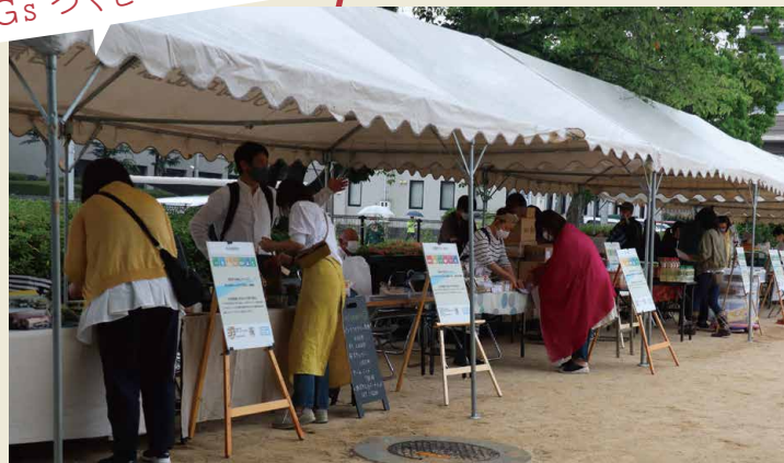
「来て・見て・触って SDGs」 体験型イベント!SDGsつくしマルシェin太宰府