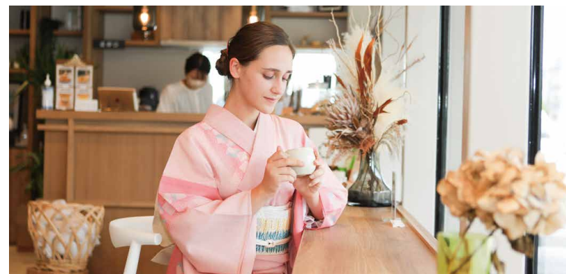
●nodoca (ノドカ) 【住】筑紫野市二日市中央 2-10-10

1 400年前に建立され、地元の人々からの厚い信仰をうける二日市八幡宮。私が訪れたこの日、御神木となつている銀杏大樹はまだ元気な緑色をたたえていて、黄色く色づくまであと少しという様子。それでもその大きさとパワーには圧倒される。ちょうど色づく季節には、散つた銀杏の葉で境内が黄色い絨毯を敷いたように彩られるという。また再び来よう。今度は友人を連れて。 長いようで短かつた今回の散策。最後は、nodocaでティータイム。おしゃれに過ごしやすい空間が整えられた店舗にはガス暖炉の火が優しく煌めく。このお店も寒い季節に来たらより一層、温かさを感じられるんじゃないか。もう一度来たいところが増えすぎたかもしれない。 筑紫地区で観光と言えば、太宰府天満宮。私もプライベートで何度か訪れた。筑紫野にもこんなにたくさん魅力があるんだ。美しい。自然と歴史と人が煌めいている。実際に足を運んでみて、またひとつ、このまちのことが好きになった。