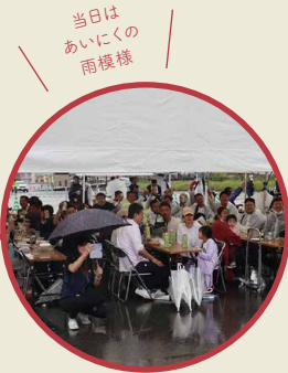
当日は あいにくの 雨模様