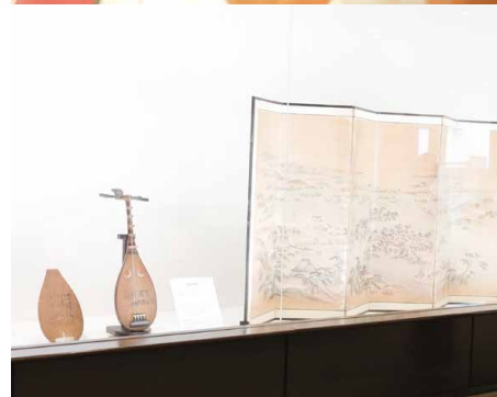
●五郎山古墳館【住】筑紫野市原田 3-9-5