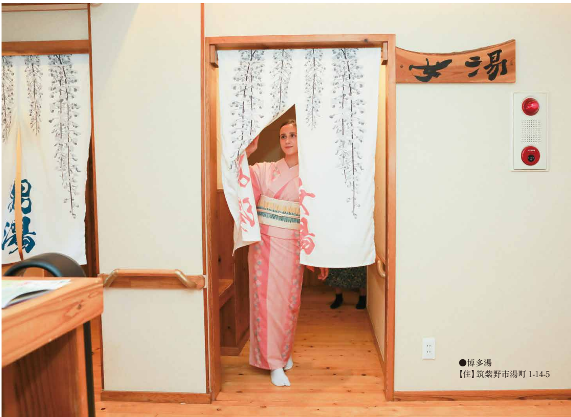
●博多湯【住】筑紫野市湯町 1-14-5