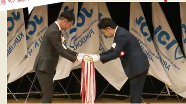
来年の開催地であるJCI柳川へ 友情の鍵を伝達しました